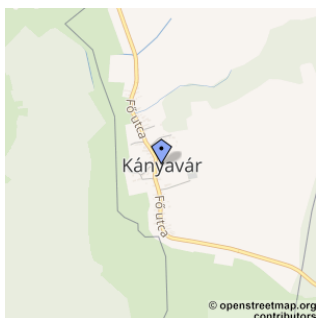
Település leírása Kányavár